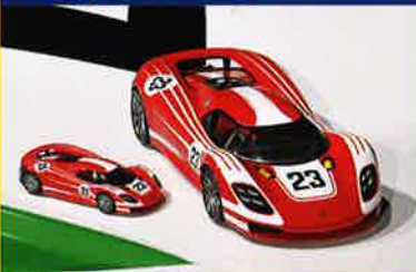
Die NZG-Porsche in 1:43