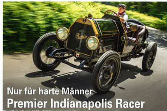
Nur für harte Männer Premier Indianapolis Racer