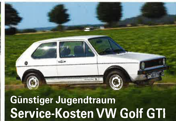
Günstiger Jugendtraum Service-Kosten VW Golf GTI