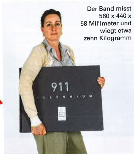
Der Band misst 560 x 440 x 58 Millimeter und wiegt etwa zehn Kilogramm

■ Mit dem Werk „911 Millennium“ ist ein einmaliges Sammlerstück erschienen. In dem auf 911 Exemplare limitierten Buch zeigt Fotograf René Staud auf 288 Seiten etwa 200 Abbildungen, die Elfer-Fans die Herzen höherschlagen lassen. Ausgeliefert wird es mit einer nummerierten Plakette, einer Transporttasche und weißen Mikrofaser-Handschuhen. Preis 1900 Euro. Bestellbar unter shop.911millennium.com