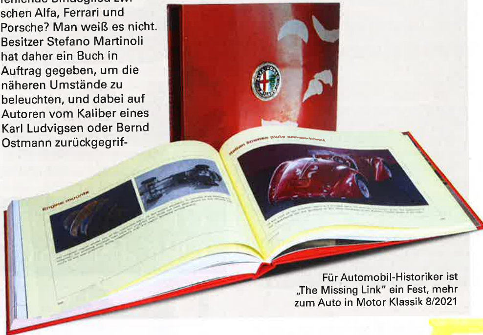
Für Automobil-Historiker ist „The Missing Link“ ein Fest, mehr zum Auto in Motor Klassik 8/2021

fen. Die 265 Seiten lesen sich (in englischer Sprache) spannender als ein Krimi, zu haben ist das limitierte Buch für 450 Euro auf progetto33-shop.ch