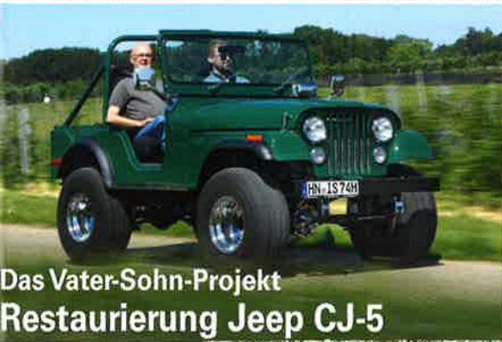
Das Vater-Sohn-Projekt Restaurierung Jeep CJ-5