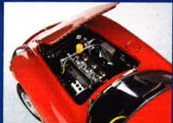
Jaguar XJ.S in 1:18