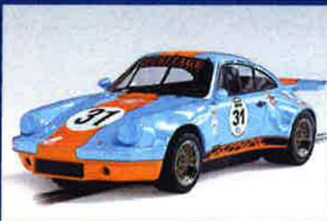
Revells LM-Sieger in 1:24