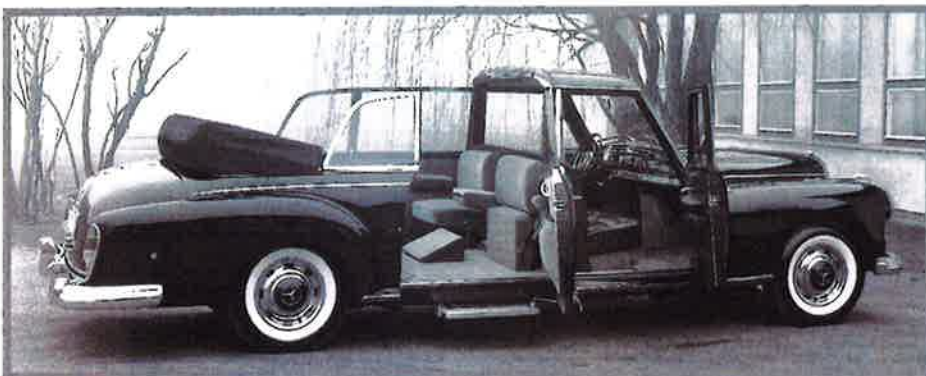
Trittbretter, verlängerter Radstand, ein Einzelsitz im Fond und Klappsitze für die Begleiter: Für seinen Einsatz als Papstwagen wurde bereits der Vorgängertyp Mercedes-Benz 300 d Landaulet (1960, Baureihe W189) umfangreich modifiziert.

Das einzige, was am goldfarbenen Modell M-217 – neben Motor und Bremsen – nicht wie beim Original funktionieren kann, das dürfte der kleine Röhrenfernseher hinter der ersten Sitzreihe sein, dem die seltsam anmutende, ausziehbare Antenne auf dem Kofferraumdeckel ihr Dasein zu verdanken hat. Das verschmerzen wir doch mit Leichtigkeit angesichts der damaligen Bildqualität. Aber vielleicht war der TV-Empfang in den USA besser, denn gerade dort wurden die wenigen Pullman-Wagen gerne mit einem Fernsehgerät ausgestattet.