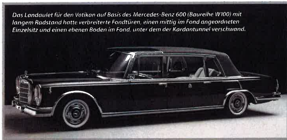
Das Landaulet für den Vatikan auf Basis des Mercedes-Benz 600 (Baureihe W100) mit langem Radstand hatte verbreiterte Fondtüren, einen mittig im Fond angeordneten Einzelsitz und einen ebenen Boden im Fond, unter dem der Kardantunnel verschwand.