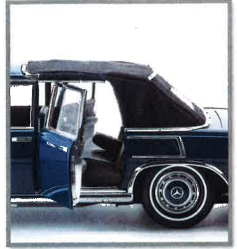
Szenen einer Bewegung: So öffnet und schließt sich das Textilverdeck des CMC-Modells, und zwar genau so, wie es auch beim großen 600er öffnet und schließt. Die Seitentüren öffnen und schließen auch bei geschlossenem Verdeck. Das erschließt sich aus dem Selbstverständnis von CMC.

haben aber alle Landaulets gemeinsam: Solche Exklusivität im Zeichen des Sterns ließ sich der Hersteller gewiss gut bezahlen, aber das ganz diskret. In der offiziellen Preisliste tauchte die Karosserieform Landaulet jedenfalls erst gar nicht auf. Zu seiner Bauzeit galt der W 100 mit dem hinteren Klappverdeck jedenfalls als teuerster Serien-Personenwagen.