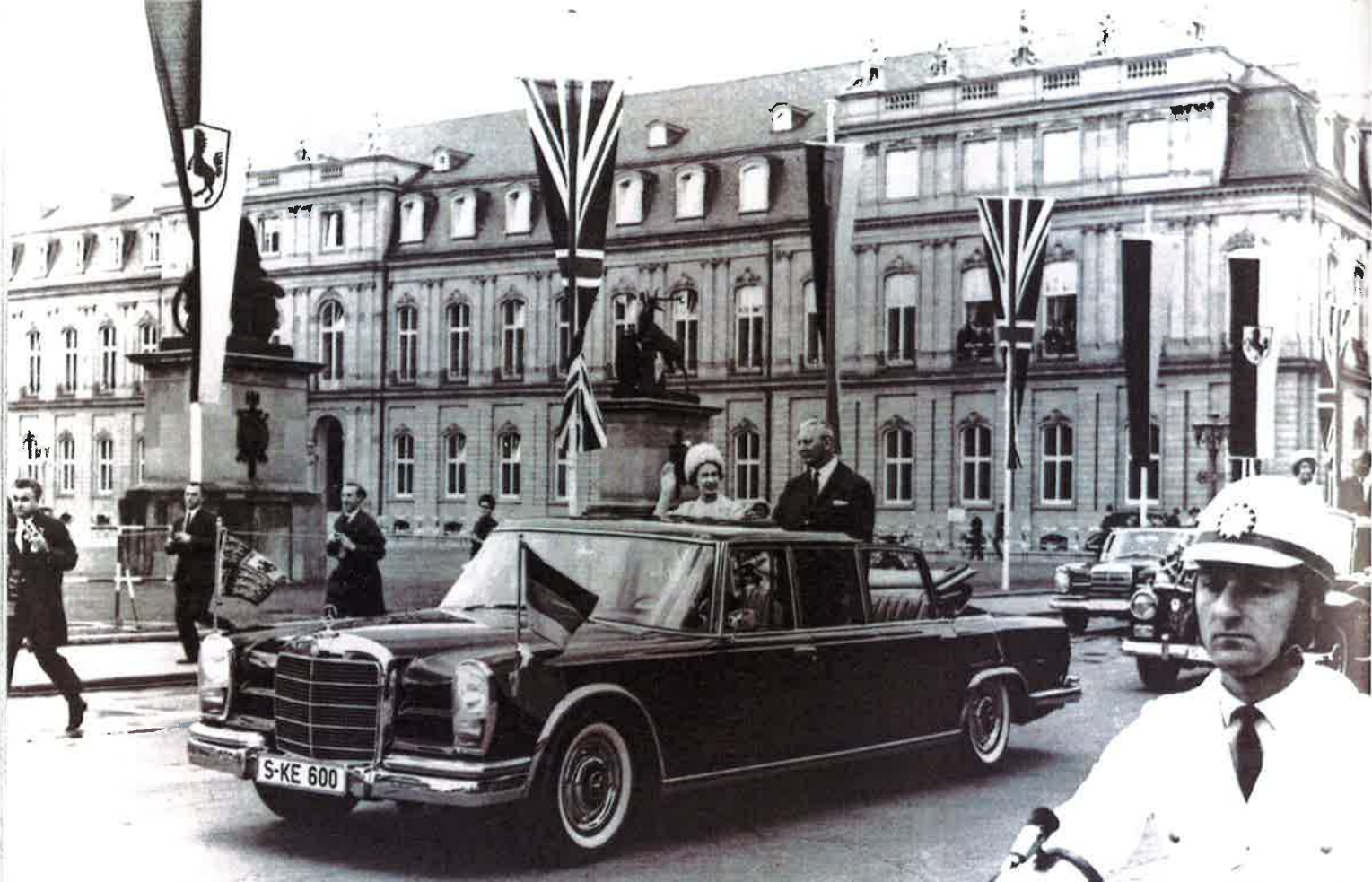
Queen Elizabeth II. und Kurt-Georg Kiesinger, damals Ministerpräsident von Baden-Württemberg und anschließend Bundeskanzler, beim Staatsbesuch 1966 in Stuttgart in einem Mercedes-Benz Typ 600 Pullman-Landaulet.