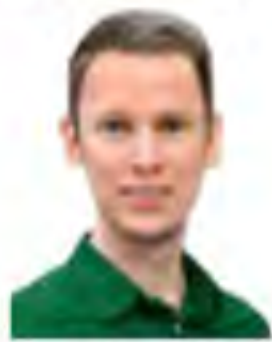
GESAMMELT VON Marcel Nobis