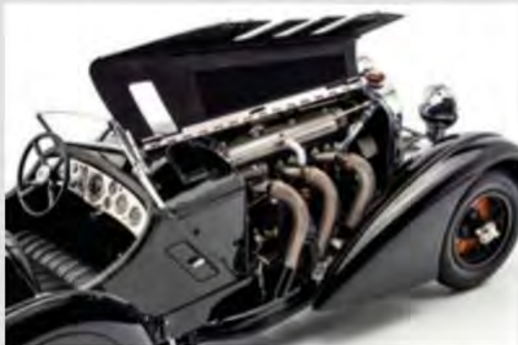
Unter der geteilten Motorhaube schlummert der Sechszylinder, mit dem der originale Trossi über 200 km/h erreicht