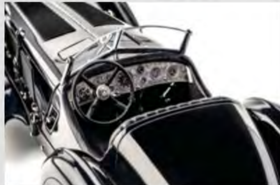
Einzeln eingesetzte Rundinstrumente und echtes Leder verleihen dem Innenraum eine authentische Optik

★★★★★= sehr gut, ★★★★= gut, ★★★= befriedigend, ★★= ausreichend, ★= mangelhaft