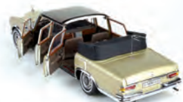
Mercedes-Benz 600 Landaulet

Jeden z dnes už ponúkaných (zatiaľ na objednávku – limitovaná séria) “zaručene nobl-lakov”... Vyrábať sa bude bez posuvnej časti strechy, no i s ňou (prší - neprší, padajú ľadové krúpy – či je tam už prídusno..?)