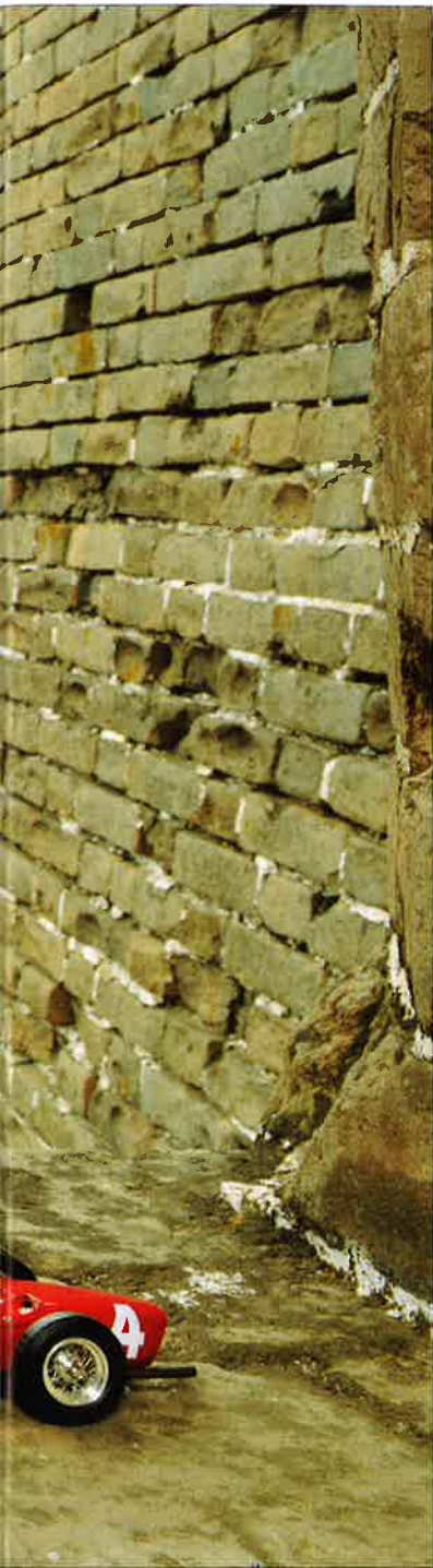
Ferrari Sharknose auf der großen Mauer (großes Bild), Bartoletti im China-Hafen (Mitte rechts) und Produktion des Mercedes SLR als 1:12er in der Fabrik von CMC (rechts)