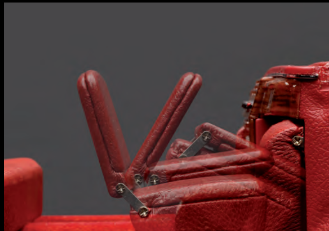
[2] Vorbildgetreu funktionsfähige Klappsitze in der zweiten Sitzreihe