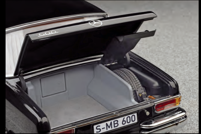
[6] Minutiöse Nachbildung von Reserverad und Bordwerkzeug im Gepäckraum

Wie beim Original: Windabweiser an den hinteren Türen und Vorhänge im Fond