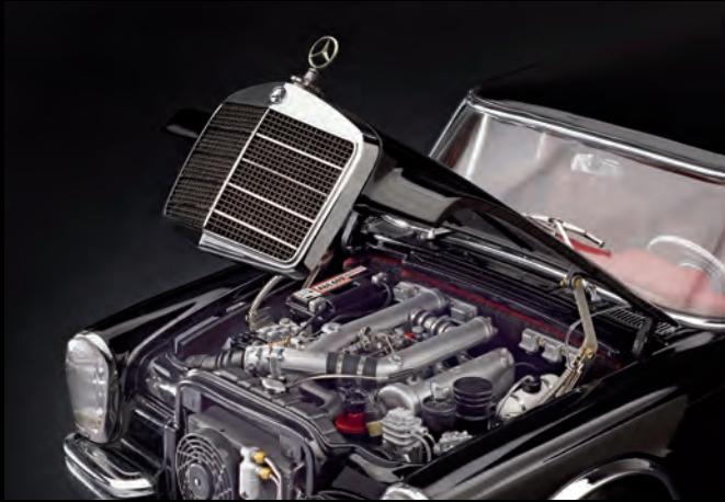
[4] Originalgetreu nachgebildeter Mechanismus der Motorhaube mit Scharnieren und Federn