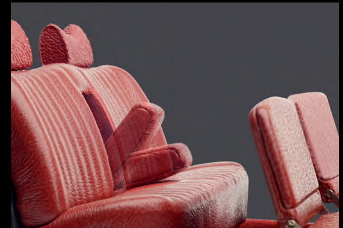
[3] Fondsitzanlage mit funktionsfähiger Mittelarmlehne