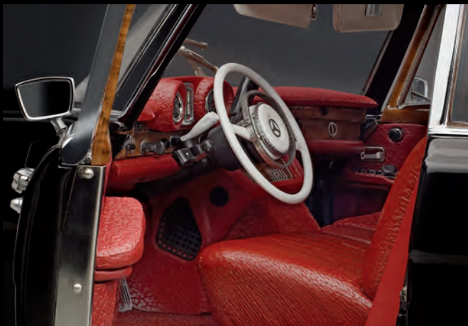
[1] Innenraum mit Bezügen aus Echtleder und detaillierter Nachbildung des Edelholzdekors

Als erste Variante des legendären Repräsentationsfahrzeugs bietet CMC die sechstürige, 6- bis 7-sitzige Pullman-Limousine an.