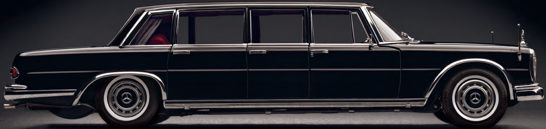
[7] Art.-Nr. M-200 MC Mercedes-Benz 600 Pullman-Limousine, Außenfarbe schwarz, Interieur rot; handmontiertes Metall-Präzisionsmodell aus über 1230 Teilen

Standartenhalter liegen in separater Box bei, die Radzierblenden haften magnetisch