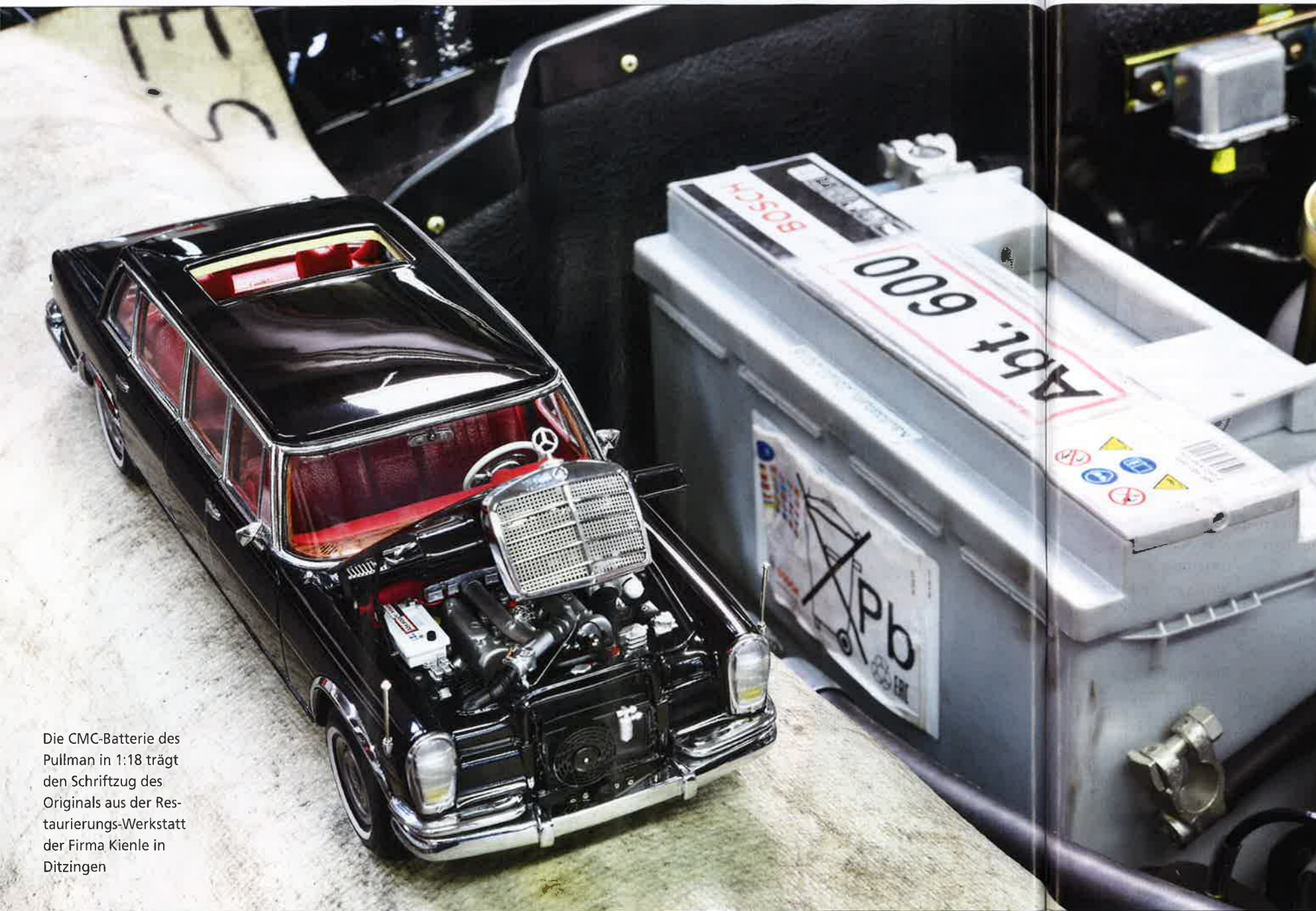
Die CMC-Batterie des Pullman in 1:18 trägt den Schriftzug des Originals aus der Restaurierungs-Werkstatt der Firma Kienle in Ditzingen

Es kann nur einen geben: Als der Mercedes-Benz 600 Pullman 1963 erstmals in Automagazinen für die große Öffentlichkeit zu sehen war, hielten die Fans den Atem an. Denn die Stuttgarter zeigten jedem anderen Konkurrenten mit diesem Auto, wo der Barthel den Most holt. Der große Wagen ging an Grenzen und sogar darüber hinaus, und heute würden ihm die Rotstiftler viele seiner majestätischen Unvergleichlichkeiten und Koketterien zusammenstreichen. Aber 1963 galt uneingeschränkt und radikal „Das Beste oder nichts“, wenn es um diese Baureihe W100 ging. Luftfederung, Bilstein-Stoßdämpfer mit wählbaren Kennlinien, Telefon, Gegensprechanlage, 6,3-Liter-V8 mit 250 PS, neigungsverstellbares Knautschsofa im Heck, Schlösser mit Chronografenmechanik und im Wagen sorgsam verlegte pneumatische, unterdruckpneumatische und hydraulische Adern für Fensterheber und Co. Und „der eilige Gral“ ist als Headline ebenso berechtigt. Denn immerhin beschleunigt der 2770 Kilogramm schwere Pullman von null auf 100 Stundenkilometer in zehn Sekunden. Aber: Wer will das schon wissen?