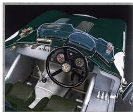
Das Renncockpit von Nr. 18: Da stecken sogar die Reservezündkerzen in den Halterungen. Das hat CMC topp recherchiert und topp umgesetzt.

Über Umsetzung der Formen oder die schon perfekt zu nennenden Gravuren sowie feinste Spaltmaße an den zu öffnenden Teilen brauchen wir an dieser Stelle nicht lange zu reden, das ist für CMC eine Selbstverständlichkeit. Das gilt auch für die Felgen, die Lackierung oder das Cockpit. Nein, was den Betrachter stets erstaunen lässt, das sind die kleinen Details, auf die der Hersteller bei der Recherche achtet und sie mit Sorgfalt umsetzt. Das sind beispielsweise beim C-Type Le Mans '53 (#19) im Cockpit die sechs sauber in ihren Halterungen steckenden Reservezündkerzen oder das auf dem Schalthebel wiedergegebene Schaltschema des Getriebes. Dazu kommen der zum Original passende Ausschnitt der Frontscheibe, die skalierten, farbigen Armaturen oder die wunderschönen Speichenräder – der Verfasser könnte garantiert noch ein, zwei Seiten mit allen diesen Details füllen, aber das