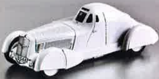
Super-Lambo in 1:12