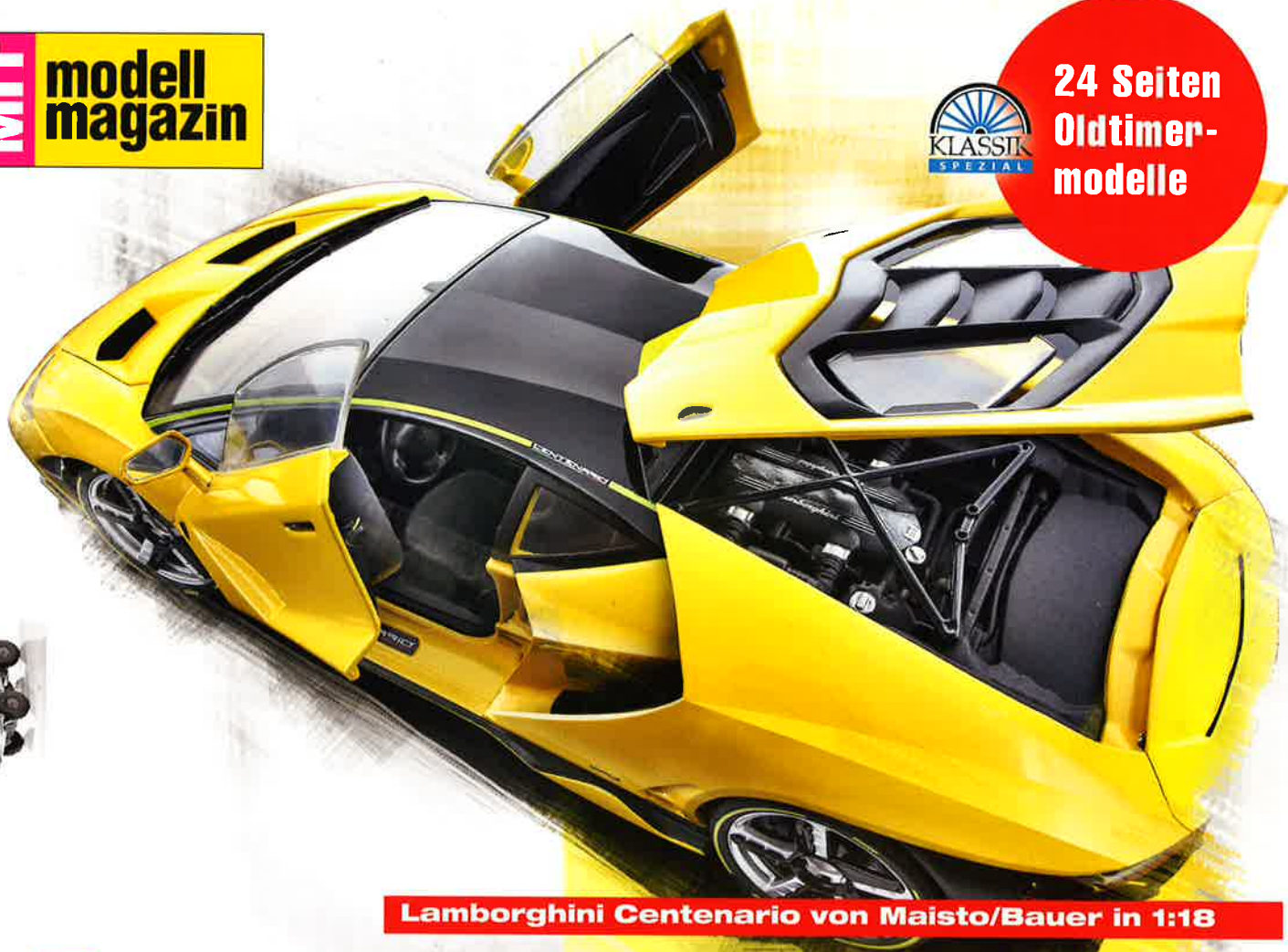
Lamborghini Centenario von Maisto/Bauer in 1:18