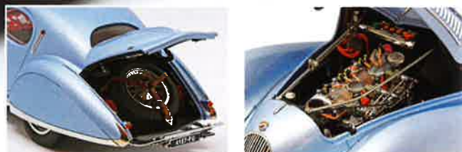
Motorhaube und Kofferraum können geöffnet werden und darunter finden sich herrliche Details.