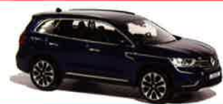
Renault Koléos Norev 1/43° A la une