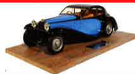
Bugatti Type 46 Profilé 1933 Panthéon 1/18° A la deux