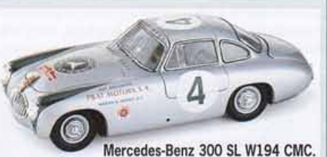
Mercedes-Benz 300 SL W194 CMC.

Si pour le commun des mortels, tous les coupés Mercedes-Benz à portes « papillon » sont des 300 SL, il convient de bien les distinguer, car entre les uns et les autres, les différences sont plus importantes que les ressemblances. L'histoire commence en 1952 avec les W194 qui sont d'authentiques machines de course, gagnantes des 24 Heures du Mans et de la Carrera Panamericana, reproduites par CMC. Le 6 février 1954, au Salon de New-York, le constructeur de Stuttgart présente le Coupé 300 SL portant la désignation W198. C'est un véhicule de Grand Tourisme qui deviendra très vite célèbre et qui existe au 1/18 e chez B-Burago et Kyosho. Enfin, le coupé 300 SLR Uhlenhaut Type W196S - et la lettre « R » a toute son importance - n'est rien d'autre qu'une voiture de compétition semblable, à la carrosserie près, à la gagnante des Mille Miglia en 1955, elle-même dérivée de la W196 de Formule 1, toutes les deux reproduites notamment par CMC.