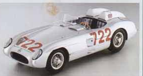
Mercedes-Benz 300 SLR W196S Mille Miglia CMC.