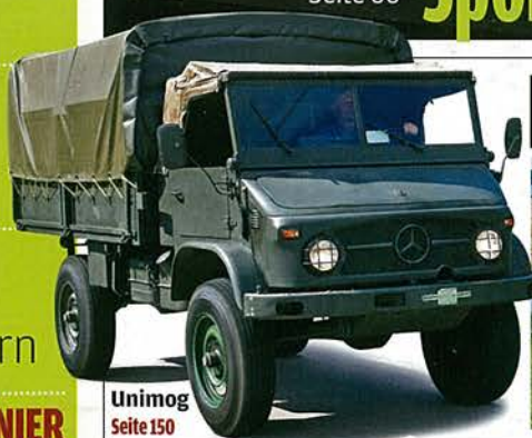
Unimog Seite 150