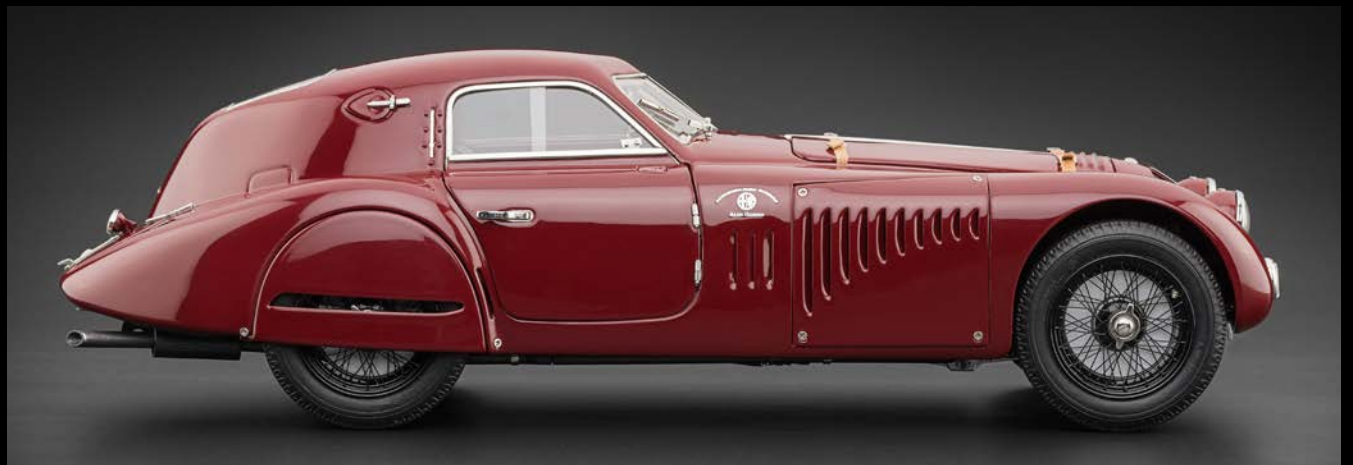
Touring-Karosserie als geschlossener Aufbau (Coupé) in Leichtbauweise als Superleggera.