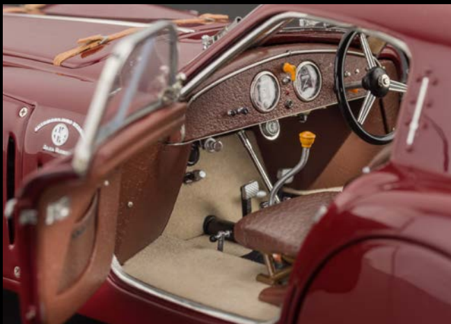
Ein Wagen zum Träumen. Eine attraktive Innenausstattung des Cockpits läßt keine Wünsche offen.