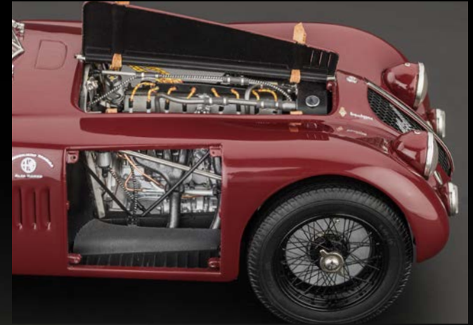
Hochdetaillierter 8-Zylinder-Reihenmotor. Kurbelgehäuse bestehend aus zwei Leichtmetall-Blöcken mit je vier Zylindern.