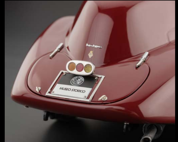
Hinteransicht des Museums-Fahrzeugs mit verriegelbarer Kofferraumhaube und Museumstafel „Storico“.

CMC ist es gelungen in enger Abstimmung mit dem Alfa Romeo Museum „Storico“ dieses Kleinod der Alfa Renngeschichte als High-End Modell der Premiumklasse zu entwickeln.