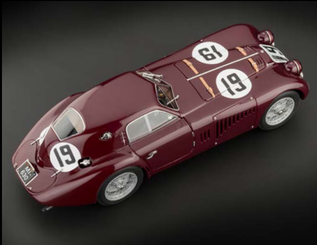
Das Le Mans – Rennfahrzeug aus der Vogelperspektive mit der legendären Startnummer 19.