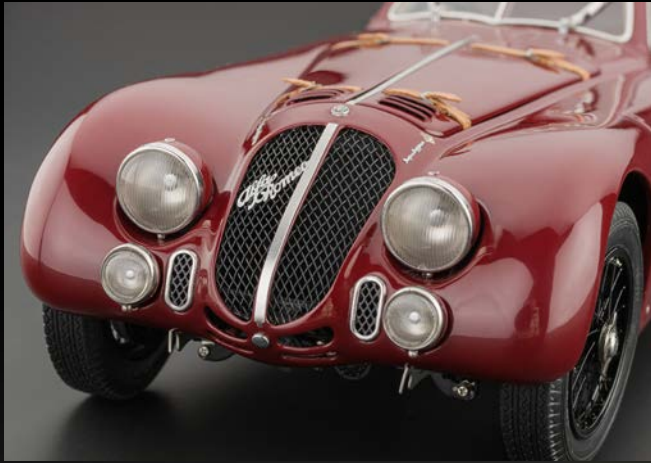
Der Alfa Romeo 8C 2900 B war zur damaligen Zeit (30er Jahre) das schnellste Straßenfahrzeug.