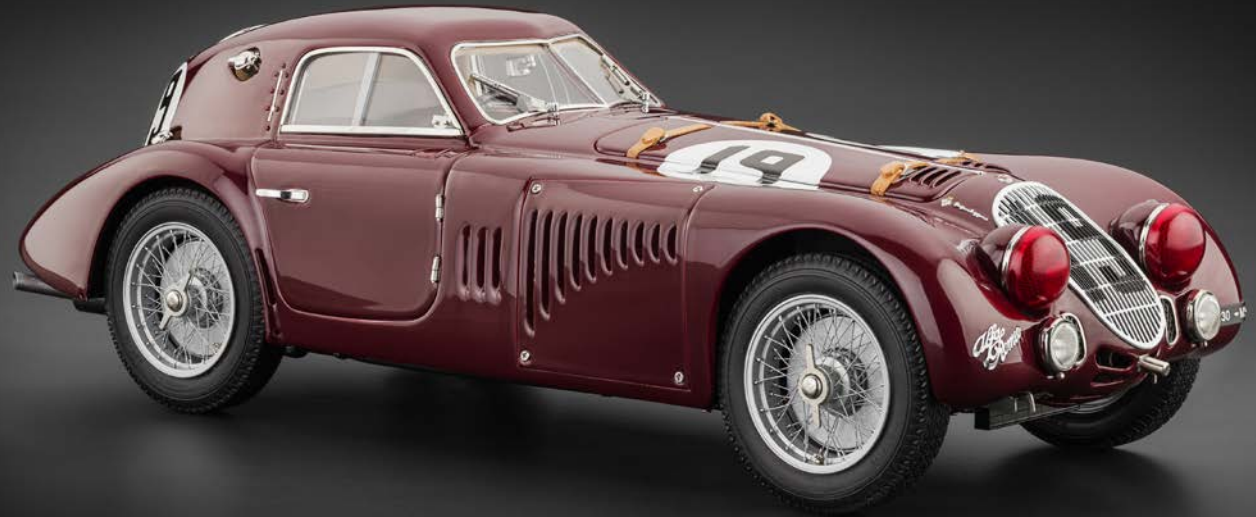
Die Le Mans – Rennversion 1938. Das Fahrerteam Raymond Sommer und Clemente Biondetti führten bis zur 20. Rennstunde mit uneinholbarem Vorsprung von ca. 160 km das Rennen an. Ein Reifenplatzer verhinderte den schon sicher geglaubten Sieg.

Fiat Official Licensed Product. Produced under license of Fiat Group Automobiles S.p.A. Alfa Romeo, all associated logos and distinctive designs are property of the Fiat Group Companies.