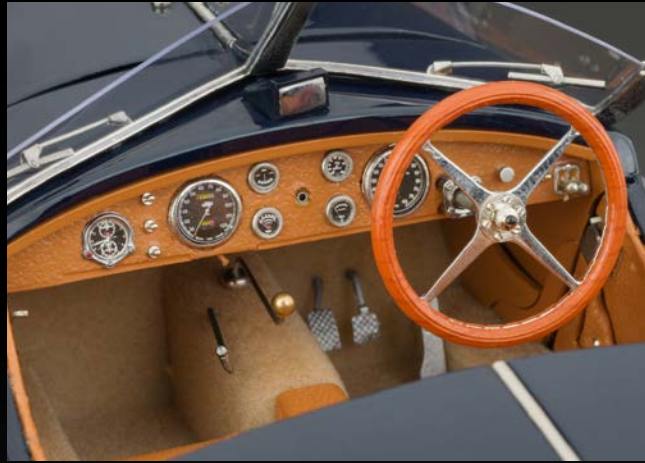
Fein ausgearbeitetes Armaturenbrett mit allen Anzeigeinstrumenten und Bediensaltern.