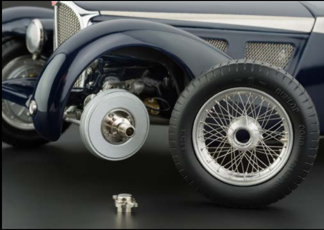
Perfekte Speichenräder und schraubbare zweiflügelige Zentralverschlüsse mit Rechts- / Linksgewinde zum Abnehmen der Räder.