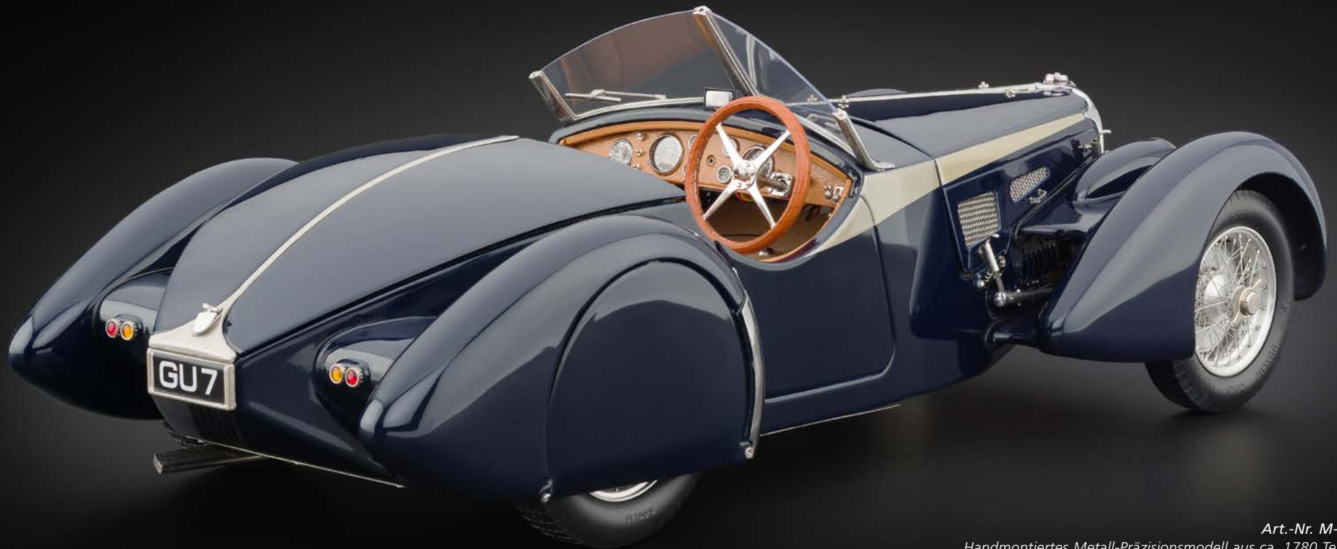
Art.-Nr. M-106 Handmontiertes Metall-Präzisionsmodell aus ca. 1780 Teilen. Eine betörende Modell-Schönheit, die in keiner Oldtimer-Sammlung fehlen darf.