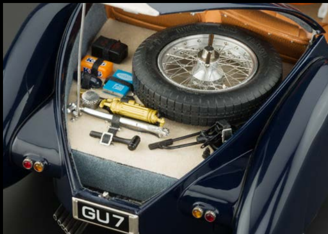
Im abschließbaren Kofferraum sind Wagenheber, Luftpumpe, Fettpresse, Teileboxen und Werkzeugsatz als Miniaturen hinterlegt.