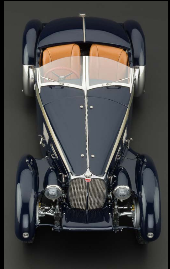
Vorbildgetreue Darstellung der markanten Fahrzeug-Frontpartie mit den ästhetisch integrierten Scheinwerfern.