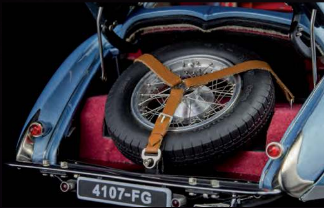
Authentisch bis ins Detail: Reserverad mit abnehmbaren Lederriemen gesichert.