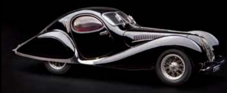
Art.-Nr. M-166 (Schwarz, limitiert auf 1.500 Stück)