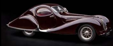
Art.-Nr. M-179 (Aubergine, unlimitiert)