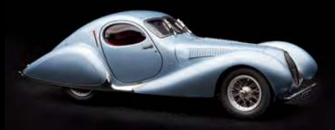
Art.-Nr. M-145 (Graublau, unlimitiert)

Art.Nr. M-166 ist in einem eleganten Schwarz lackiert und ist ebenfalls weltweit auf 1.500 Stück limitiert.