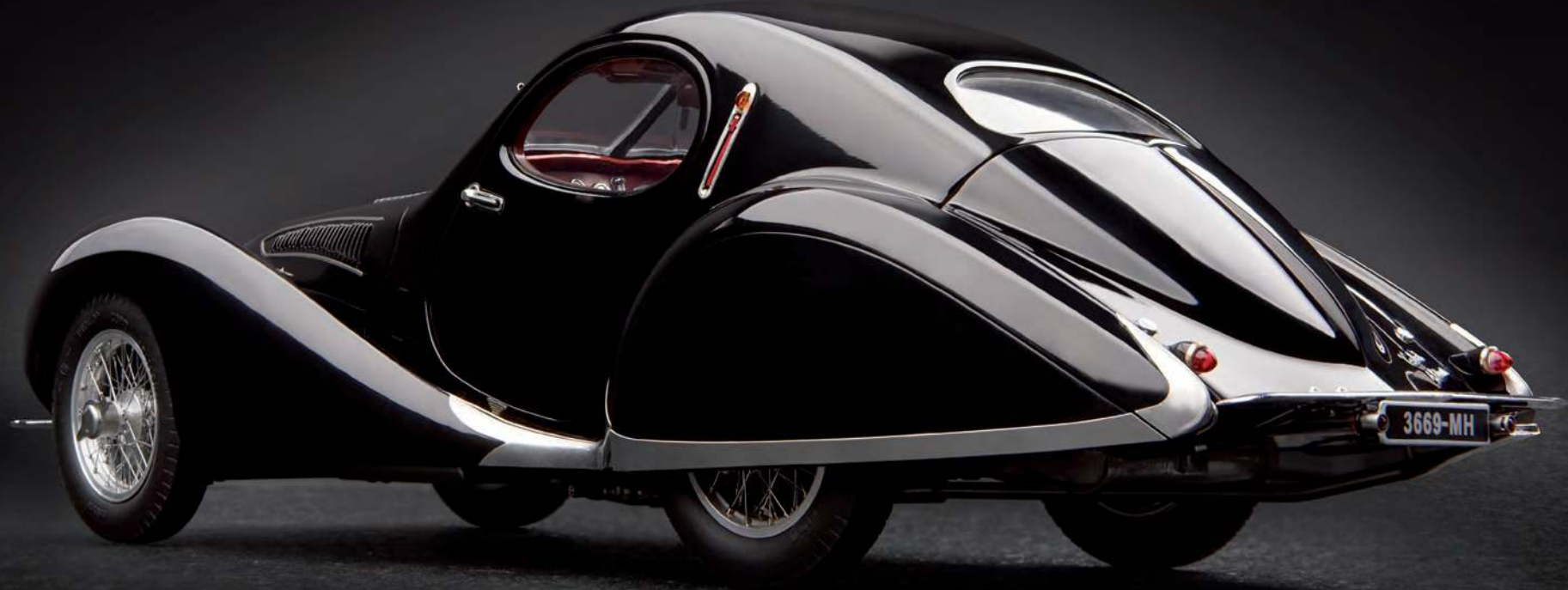
Im Automobildesign ist oft von „fließenden Linien“ die Rede. Beim Talbot Lago Coupé könnte der Ursprung dieses Begriffs liegen.