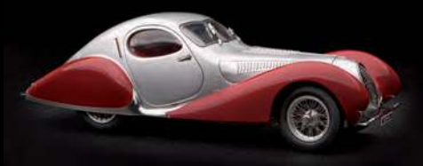
Art.-Nr. M-165 (Silber/Rot, limitiert auf 1.500 Stück)