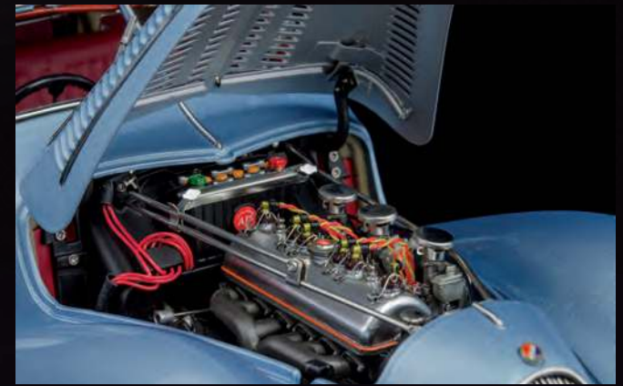
Auch unter der Haube ein Kunstwerk: Sechszylinder Reihenmotor mit Doppelvergasern und allen Anbauaggregaten und Leitungen.