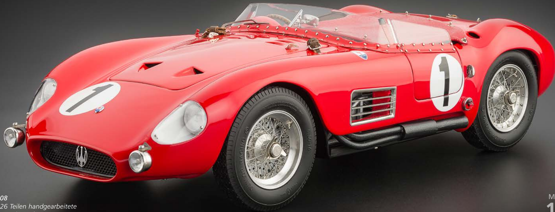
Art.-Nr. M-108 Aus über 1.926 Teilen handgearbeitete Miniatur der Premium-Klasse.

Das vorliegende Modell ist eine exzellente Präzisionsreplik, die den originalen Bauzustand des Vorbild-Fahrzeugs beim 24 Stunden-Rennen von Le Mans im Jahre 1958 minutiös nachzeichnet. Die handgefertigte Miniatur besteht aus 1926 Einzelteilen und ist auf weltweit 3000 Stück limitiert. Wir gratulieren zum Erwerb dieses einmaligen Sammlerstücks.