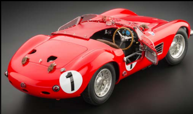
Zu öffnende Türen, abnehmbare Motorhaube und Heckklappe. CMC setzt ein weiteres Highlight mit dem exklusiven 1:18 Modell.