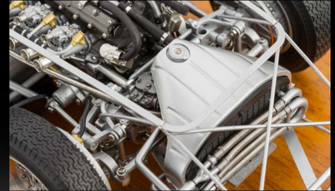
Eine überwältigende Detailfülle. Selbst die aufwendige Radaufhängung und Bremsenmechanik sind vorbildgetreu umgesetzt.