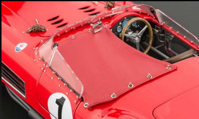
Die Sitze und Persenning sind mit echtem Leder bezogen. Das Armaturenbrett mit Rundinstrumenten ist präzise nachempfunden.

Ab 1955 schuf Maserati mit dem 300 S einen Rennsportwagen der im internationalen Wettbewerb immer eine Spitzenposition einnahm und viele Erfolge feiern konnte.